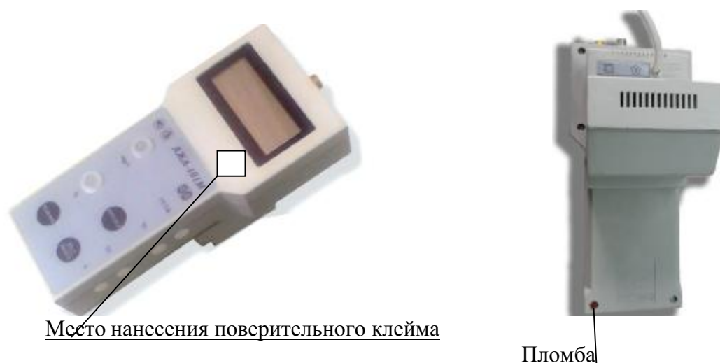
Рисунок 2 – Схема нанесения знака поверки (слева) и опломбирования (справа)